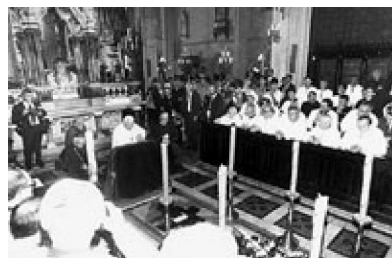
Papa Ivan Pavao II. veliki je stovatelj Stepinceva djela

Stepinac je treci blazenik u Hrvata; vjernici zeljno isekuje njegovu kanonizaciju i pridruzivanje opcinstvu svetih, gdje "od nasih" vec "stoluju" Nikola Tavelic, Bogdan Leopold Mandic i Marko Krizevcenin. Trenutacno, slican se postupak ocekuje za blazene: Augustina Kazotica, Gracija iz Mula i Ozanu Kotorsku. Inace, prije dolaska Hrvata u ove krajeve, Crkva si je ovdje priskrbila mnoge svece: sv. Duje, sv. Jerolim Euzebije, sv. Kaja, sv. Mavro, sv. Dimitrije, sv.